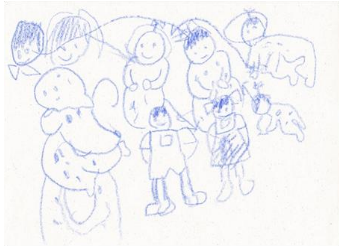
B. 12 éves, családrajz

Úgy gondolom, kézzel fogható változásokon mentek át a gyermekek a terápia során. A rajzokon ez egyértelműen megmutatkozik, de ugyanez elmondható a súlyos állapotú autista gyermekek hangszeres „zenéléséről” is, akik már ismerősként fogadták mind személyemet, mind pedig a „zajkeltő eszközöket”, amiket már a saját örömeikre, önmaguk kifejezésére is tudnak használni.