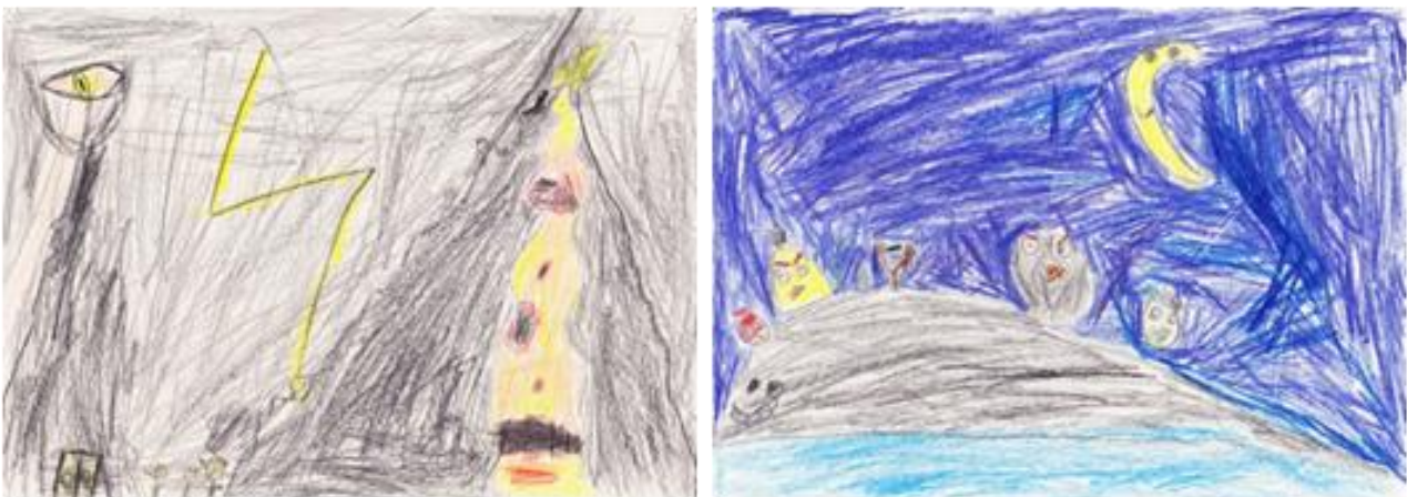
P. 12 éves, tele elfojtott agresszióval