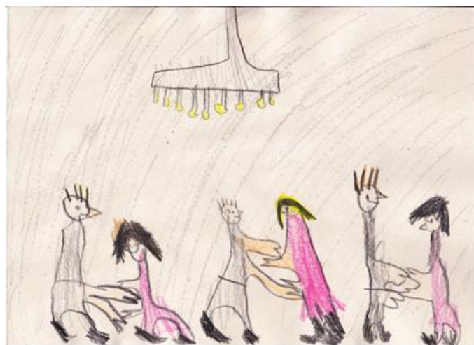
T. nyugodt lelkiállapotban, biztonságérzetének megtalálása után