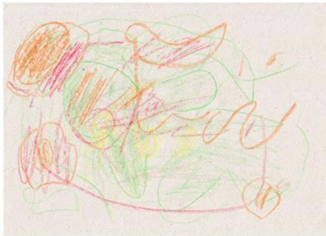
B. 12 éves, nincsenek konkrét formák, csak firka és geometriai alakzatok (kisgyermekkorra jellemző)