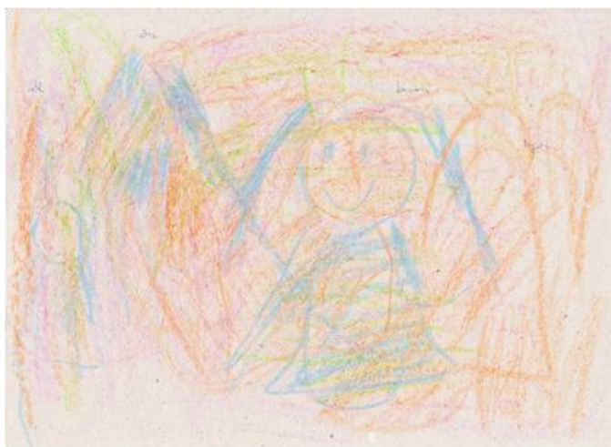
B. 12 éves, már vannak formák, emberalak is, viszont utolsó mozzanatként az egészet átsatírozta